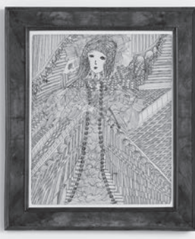
SAMMLUNG ——— ZANDER

Die Sammlung Zander im Schloss Bönningheim zeigt einzigartige Kunstwerke der Naive, Art Brut und Outsider Art. Damit ermöglicht das Museum einen Einblick in eine international anerkannte Kunstströmung, die sich parallel zur Avantgarde zu Beginn des 20. Jahrhunderts entwickelte und als Inspiration für zahlreiche Künstler fungierte.