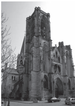
Rouffacher Kirche Église Notre-Dame de l'Assomption (Mariä Himmelfahrt)